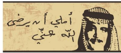
مؤسسة إبراهيم العنقري وذريته الخيرية IBRAHIM AL-ANGARY AND HIS DESCENDANTS FOUNDATION